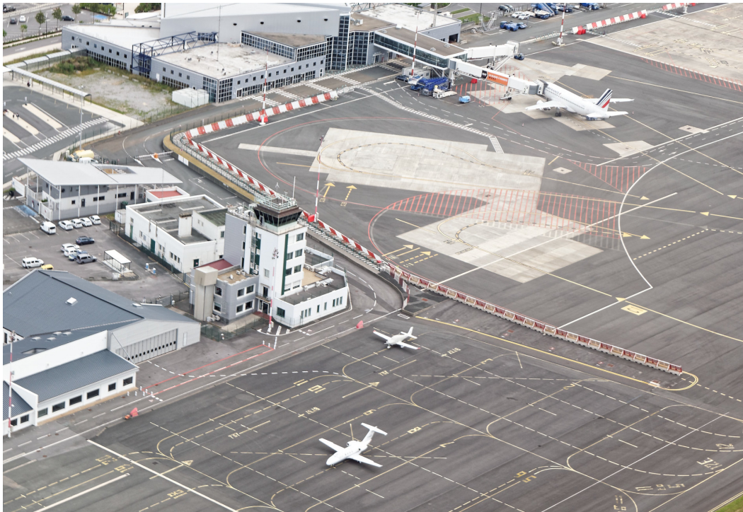
L'aéroport de la Réunion Roland Garros

Les habitants de l'île se sont adaptés en pêchant, en cultivant et en élevant. Les habitants se sont construit des maisons. Puis ils ont construit des bateaux et des aéroports.